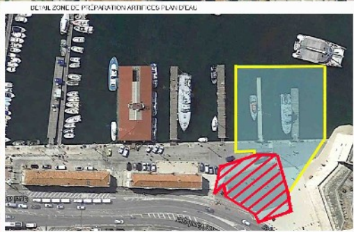
DETAIL ZONE DE PREPARATION ARTIFICES PLAN D'EAU

Navigation interdite sur la totalité du plan d'eau du Vieux-Port le 14 juillet 2021 à partir de 12h jusqu'à la fin des tirs